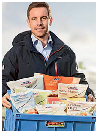
bofrost* bietet ein umfangreiches Sortiment an Tiefkühlkost